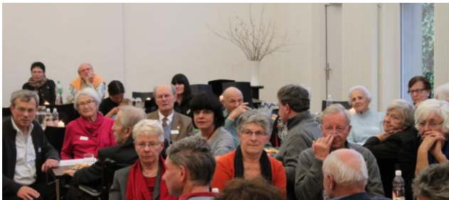
Jahresabschluss 2011 Marienkirche Bern